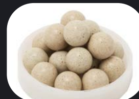
湯の花セラミック