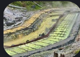
湯の花を採取する湯川